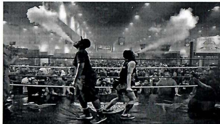
Рис. 2. Вейпинг соревнование

Быстрому распространению курения ЭС (вейпингу) способствуют компании-производители, которые превратили курение ЭС в целую субкультуру. В мире на регулярной основе проводятся субсидируемые компаниями-производителями выставки и соревнования среди курильщиков ЭС (рис.2). Это так называемые: «Cloudchasing» (мастерство выдувания облаков пара), «Tricks» (трюки с паром) и «Вейпинг-алхимия» (соревнования по составлению новых жидкостей для вейпа).