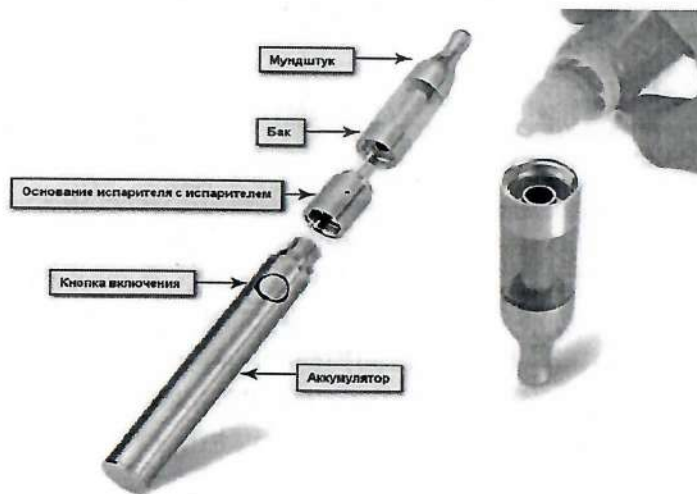
Рис. 3. Устройство электронной сигареты

Обычная электронная сигарета состоит из аккумулятора, электрического испарителя, емкости для жидкости, мундштука и дополнительных элементов для автоматического управления подачей ароматизированной жидкости (но последние имеются не во всех моделях), рис.3.