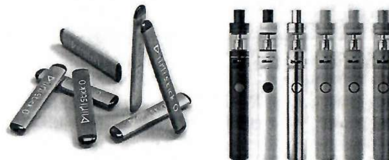
Рис. 5. Одноразовые (слева) и многоразовые (справа) электронные сигареты

Одноразовые ЭС рассчитаны на 200 - 500 затяжек пара. В многоразовых устройствах нет таких ограничений и они работают до тех пор, пока доливается жидкость в емкость.