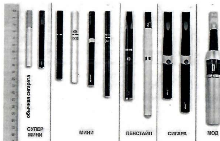
Рис.4. Типы и размеры электронных сигарет

Электронные сигареты (вейпы) классифицируются также по типу и размеру (рис.4) в соответствии с длиной (от 82 мм до 175 мм).